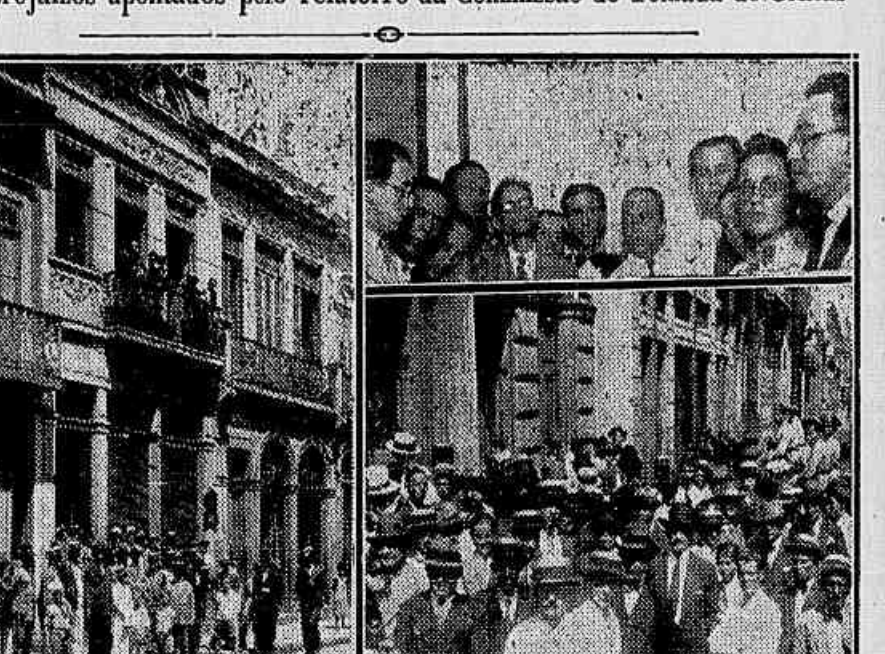
Varios aspectos tomados no domingo, em frente á Associação de Auxílios Mutuos

Os prejuizos apontados pelo relatorio da Comissão de Tomada de Contas